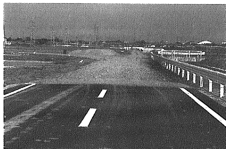
整備中の横木農道

新潟南部地区における県営の農業用水・排水路等の整備・改良の負担金。 新潟南部地区とは、新潟市の一部と亀田町・横越町内（焼山地区を除く）の農地で、亀田郷土地改良区管内です。