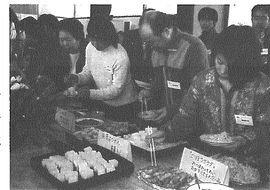
横越産の食材にこだわった料理がいっぱい — 横越の味を楽しむ集い

活性化塾「阿賀の里づくりよこごし」の活動を助成し、地域の活性化を図ります。 「阿賀の里づくりよこごし」の主な活動は、身近な町の話などを盛り込んだミニコミ紙「夢がっど」の発行や、町内外の人たちに横越の食材などについて料理を通じて理解を深めていただく「よこごしの味を楽しむ集い」（毎年2月または3月に開催）などです。