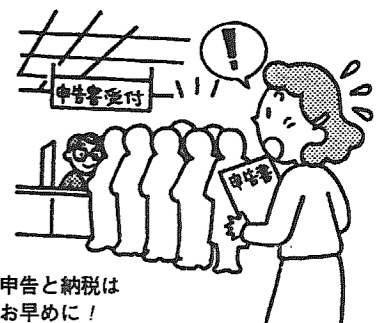
申告と納税はお早めに！