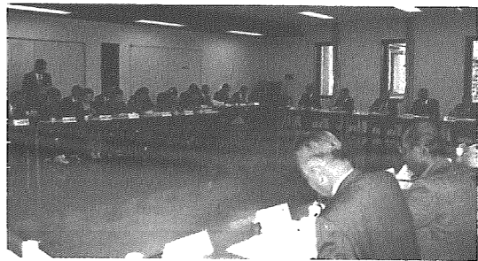
10月30日に開催された合併調査委員会初代会合

「横越町合併調査委員会」は、21世紀における横越町の総合的なまちづくりを行うことを目的に、市町村合併の是非や課題について調査および審議をするため、条例に基づいて設置された町長の諮問機関で、町内の自治会や企業等の各団体から30名（表1）が委員として任命されました。