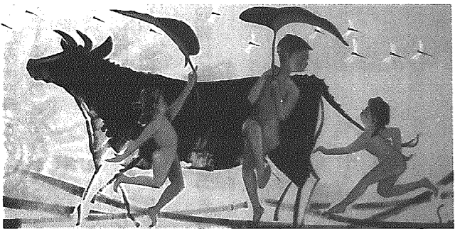
▲総合体育館の玄関ホールに飾られている絵

45年3月31日までに生まれた人） ■人間ドックの費用 本人負担1万円で受診できます。 ■健診機関・受診日 健診機関や受診日は町が指定した機関・月日から選んでください。 ■交通手段 健診機関が車で送迎いたします。 ■申し込み方法 国保の保険証の更新の時に保険証と一緒に人間ドックの受診申込書を送付しましたので、注意事項をよく読んで、必要事項を記入して9月29日までに町民生活課・国民健康保険係に提出してください。