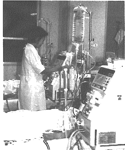
◀病院での人工透析治療

障害区分により、給付の対象となる医療が異なりますが、 現在は主に人工透析を受けている方に給付されています。