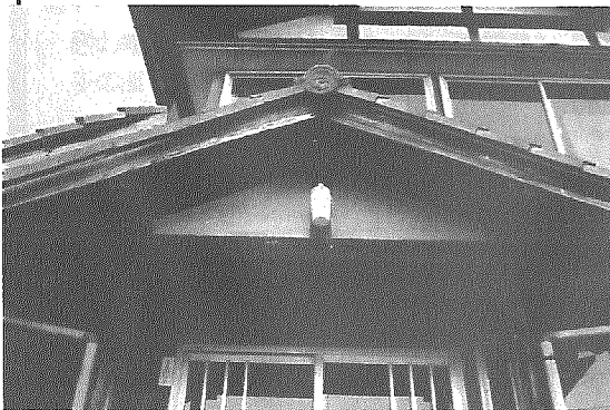
旧交番の面影を残す凝った造作の玄関の中門