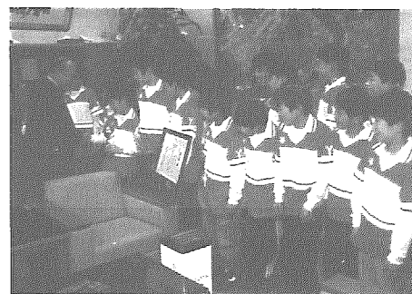
町長の激励を受ける選手たち

全国小学生ドッジボール選手権大会新潟県大会で準優勝（試合結果は広報今月号、総合体育