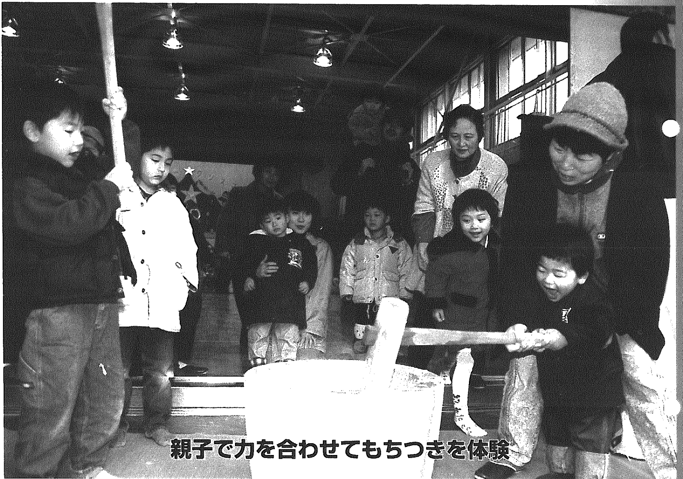
親子で力を合わせてもちつきを体験