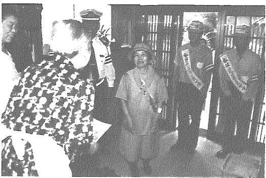
住民・行政が一緒になって交通事故のない明るい社会を実現しましょう。

飲酒運転や高速暴走運転などの悪質な違反は論外としても、少しの注意で避けられた事故も多かったのではないのでしょうか。 交通事故が起これば、事故に係わった人たちは大きな犠牲や悲しみ、苦勞を負わなければなりません。 今、あらためて一人ひとりが交通安全を考え、行動しなければ交通事故はなくなりません。