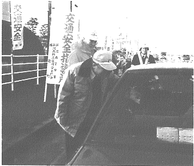
町議会3月定例会で「横越町交通安全条例」が可決され、平成11年4月1日から施行されました。 町民のみなさんひとりひとりが交通安全に努め、安全対策に積極的な参加をお願いします。

今回制定した条例では、町民の安全で快適な生活の実現を目指すために、行政が地域の特性に配慮した交通安全対策を実施することや、関係機関との連携を密にしなが、総合的な交通安全策にあたることを求めています。 さらに、住民の責務も明らかにしており、住民一人ひとりの交通安全意識の高揚を図り、地域や住民、学校、事業者等が、すべての事業活動及び日常生活において自主的かつ積極的に交通安全を推進していくことを求めています。