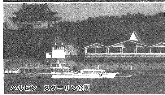
ハルビン スターライン公園

「町づくりは人づくりから」21世紀の横越町を担う青少年を育むため、町では横越小学校の高学年児童を対象に、7月下旬に「平成11年度小学生海外派遣研修」を実施します。