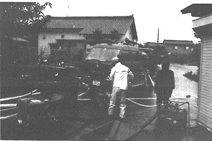
中学校前のやよい橋付近で消防ポンプ車による排水作業

内各地で計三戸が床下浸水に見舞われました。 このほか車庫や倉庫などの浸水で、自動車、農機具などが多数冠水したほか、落雷による電気製品や電話器の故障などが発生しました。また、田畑の冠水が二八畝、浸水が八一二畝あり、水稲をはじめとして、長芋、里芋など農産物に被害がありました。