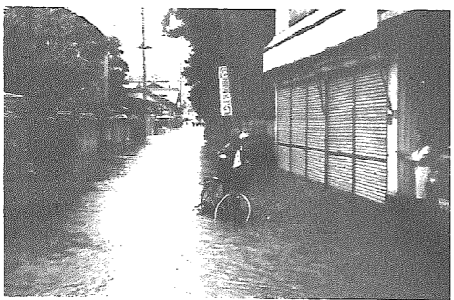
旧阿部ハキモノ店前(横越中)

この日の雨は午前一時頃から降り始め、午前七時には一時間当たり五六mmの雨量を記録し、約半日で二六四mmの総雨量がありました(グラフ参照)。これはこれまでの新潟気象台の二十四時間雨量の最高記録が一六五mmであったことから、いかに記録的な豪雨であったか分かります。亀田郷の雨水のほ