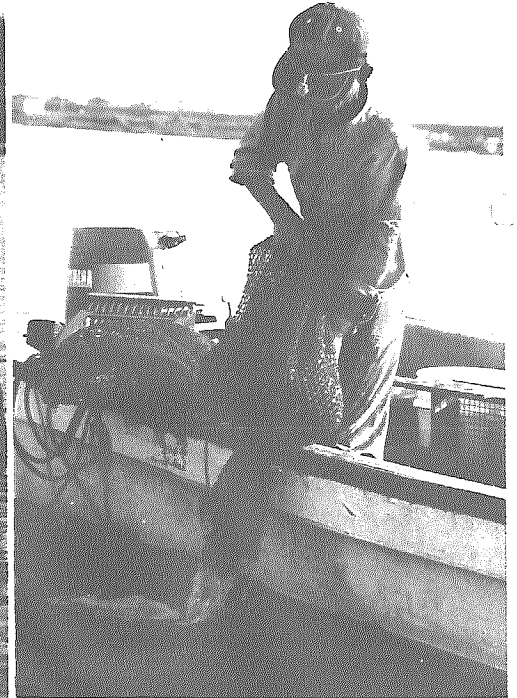
阿賀野川で2ヵ月間のしじみ捕り

七月に阿賀野川でのしじみ捕りが解禁となり、町内の漁師たちは、朝早くから舟を進ませながら勤連（じよれん）で百円玉よりも大きくなったしじみを捕っています。 漁では小さなしじみを逃がし、漁の期間を八月までの二ヶ月間だけにして、乱獲を避ける努力をしています。