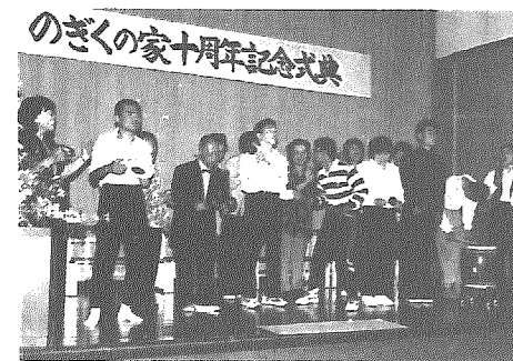
のぎくの家十周年記念式典

このほか、阿賀野川浄水場や総合体育館、北方文化博物館、新発田市のテクノカレッジや新潟市のテクノスクール、新潟商業高等学校などを視察しました。