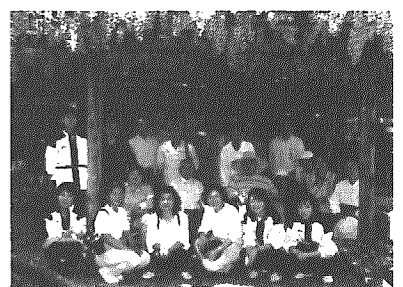
北方文化博物館で藤の花を堪能

機能回復訓練教室（あゆみの会）のお申し込みは、保健センターまでお気軽にどうぞ。 ☎三八五〇四五