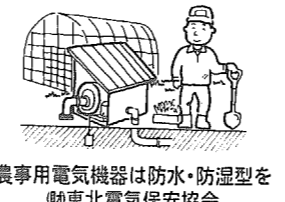
農用電気機器は防水・防湿型を(株)東北電気保安協会