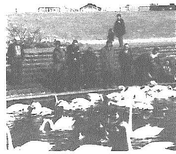
スワンパークでの視察の様子