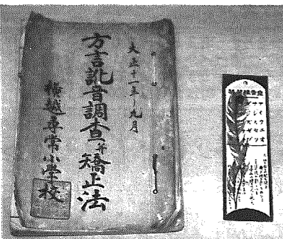
「方言訛音調査并矯正法」冊子(左)と「発音練習菜」(右)