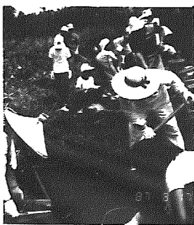
陸平貝塚の発掘作業

このフォーラムは、日本考古学の原点であり、美浦村が全国に誇れる縄文遺跡「陸平貝塚」の今後の活用をみんなで考え、住民と行政が一体となり、地域文化の創造を目指して行われたもので、講演やパネルディスカッションのほか、この貝塚に関する土器などの考古資料、貝塚周辺の自然標本、全国の十市町村