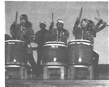
長野五輪にも披露される美浦村の縄文太鼓保存会も参加

十一月八日、村内の音楽愛好家による音楽の祭典「第十一回みほ音楽フェスティバル」が、美浦村中央公民館で開催されました。