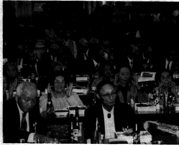
合唱や踊りを楽しむお年寄り

その後、婦人会などから赤とんぼの合唱や佐渡おけさなどの踊りが披露され、出席者から喜ばれていました。