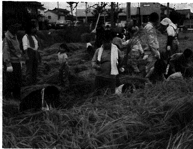
稲を刈り取る子どもたち

作業を終えた後は、公民館に会場を移し、新米のおにぎりの昼食会があり、実りの秋を満喫していました。