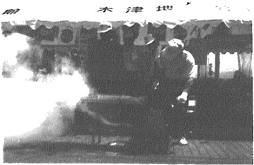
ポン菓子の実演販売