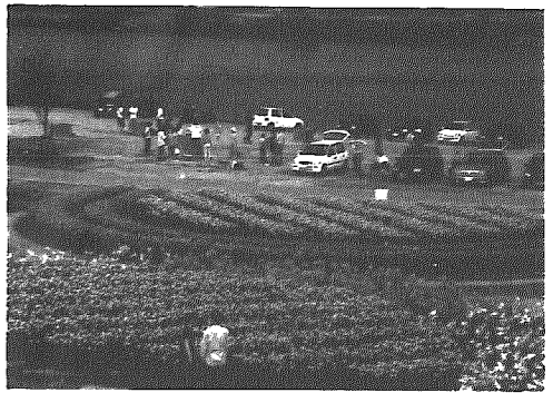
休日の公園も大勢の人々で賑わいます