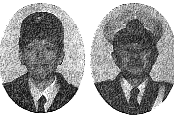
川 皆 田 品 品 田