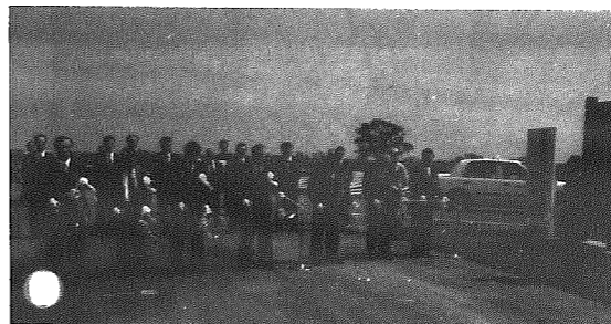
開園式でのテープカット