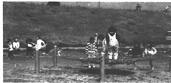
遊具で遊ぶ子どもたち

長、などの関係者が参加。テープカットの後、町長より「公園が有意義に活用されると共に、河川と横越町が更に発展することを期待します」と挨拶が述べられ、その完成を祝いました。