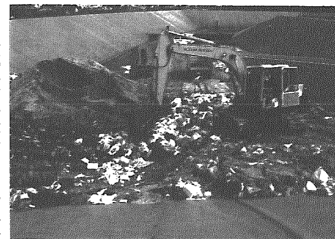
横越町最終処分場

この度、施設の老朽化と公害の発生防止に対処するため、二大ごみ処理施設が完成しました。その一つが新潟地区広域清掃事務組合が平成五年から四ヶ年事業として二百六十三億円（横越町負担一億六千万円）をかけた建設した亀田焼却場と、もう一つは、横越町が独自で平成七年から二ヶ年事業で七億六千万円かけ藤山、駒込地区に建設した横越町最終処分場です。