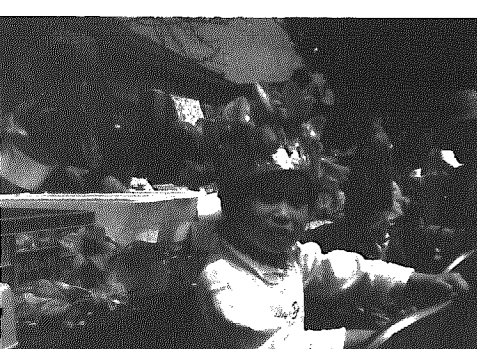
チューリップで変身（昨年のチューリップフェアより）