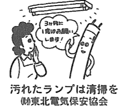
汚れたランプは清掃を