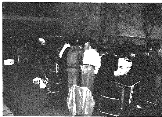
総合体育館での開票作業

知事の任期満了に伴う新潟県知事選挙は十月三日告示、また衆議院の解散に伴う衆議院議員総選挙および、最高裁判所裁判官国民審査は十月八日に公示され、十月二十日に村内八ヶ所の投票所で投票が行われ、総合体育館で即日開票されました。なお、横越村分における投票結果は次のとおりでした。