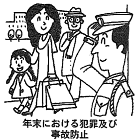
年末における犯罪及び事故防止

交通安全協会では、平成七年春の全国交通安全運動の機会に、15年・20年・25年・30年・40年の優秀運転者(無事故、無違反者)の表彰を行います。 受賞を希望される方は、交通安全協会支部長または事務局へ申請してください。 ▼申請締切期日 平成7年1月10日 ▼問い合わせ 新潟南地区交通安全協会事務局 ☎38210110