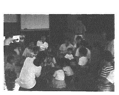
お話に聞き入る子供たち