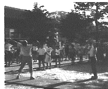
川根谷内地区ラジオ体操会

かまど作りや火起こしと全員が作業を分担し、飯炊炊さんに挑戦。初めてという人が多かったものの、思いのほか上々の炊け具合。大鍋で作ったカレーをかけて河原で大勢で食べる昼食は格別の味です。