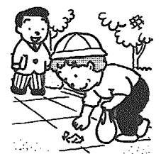
環境美化行動の日 (6月5日)

県では県の施設や事業を見学してもらう「ふれあい県政バス」事業を実施します。 ●新潟発 6月24日(金) ・実地日 衛生公害研究所、新潟国際情報大学など ●五泉発 7月6日(水) ・実地日 工業技術センター、見学先 工業技術センター、阿賀野川頭首工など ●定員 各50名 ●申込方法 往復はがきに住居、氏名、電話番号、希望日と地域名を記載して実施日の10日前までに県庁広報広聴課へお申し込みください。詳しくは、広報広聴課(☎二八三―五五一)へお問い合わせください。