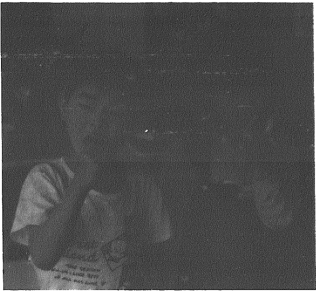
食べたらしらに磨きます