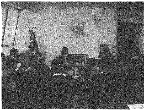
女性の校長先生からイギリスの教育事情について説明を受ける参加者