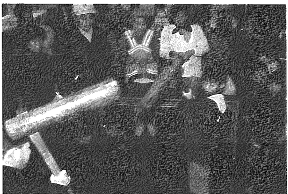
もちつき大会でもちをサービス

十二月四日から五日にかけて、横越村農協会館と同居倉庫前で横越村農業祭が行われ、水雨が降るほど肌寒く天候にもかかわらず大勢の人で賑わいました。 農業祭には、酪農組合、沢海園芸生産出荷組合、養豚組合、えのき組合、農協婦人部などの各種農業団体が参加。それぞれ横越の自慢の味が勢ぞろいした農産物品評会や地場産越冬野菜・豚肉・牛乳・乳製品などの即売のほか、農産物加工研究グループなどによる漬物加工品なども訪ずれた人たちの関心と呼んでいました。 このほか、もちつき大会・村農業経営青年会議による芋煮コーナーなどで賑わいました。 なお、農産物品評会の特別賞入賞者は次のとおりです。 ○長芋の部 横越村長賞 有限会社AFCカガヤキ 新印中央青果賞