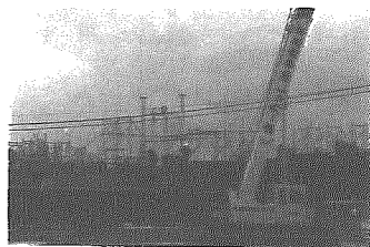
現在建設中の総合体育館

また、本年一月には、国際セミナーを予定している。ところで、国内外を研修する場合の助成制度として人材育成研修制度をつくり積極的な活用を呼びかけて