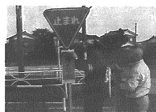
ミニ注意板を設置

秋の全国交通安全運動期間中の九月二十七日に、村内の危険交差点五十箇所に、夜間でも良く反射するミニ注意板を南警察署の協力で設置しました。 表でもわかるように、県下では毎年半数以上の事故が交差点内で発生しており、幸い、村内では四十%ではありませんが、事故全体から見れば多発と言えます。