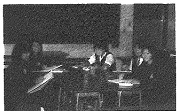
このシリーズ終り

これからも、コンクールなど大事な行事がたくさんあるので、みんなで協力しあって頑張っていくつもりです。 しかし、今のところはまだ、いまひとつ団結力に欠けています。 コンクールでは、全員が入賞するように真剣に製作に取り組みたいと思います。