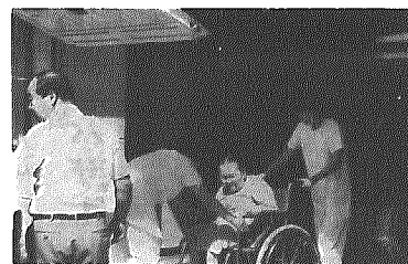
デイサービス事業のリフトバス

老人保健福祉計画策定中 村では、国の高齢者福祉十か年戦略を受けて、平成六年三月まで老人保健福祉計画を策定するため、策定委員会を設置しています。