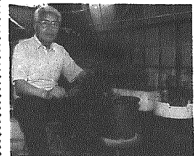
さつきは、日頃の手入れが大切

横越下地区では菊づくりやさつきづくりは、他地区よりも活発に行われているが、最近、菊づくりの後継