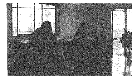
広々とした事務所内