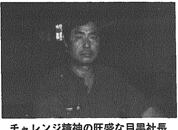
チャレンジ精神の旺盛な目黒社長