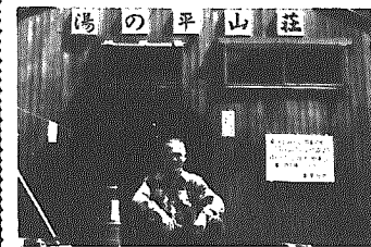
健康は、自分でつくるもの

山登り以外の健康法は、毎朝5時30分に起床し、タオルを使った乾布摩擦し、洗顔の前に洗面器の水中に目を入れてパチパチさせてから洗顔することである。それに、剣道をしたこと