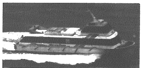
この船にもFRPが使われている