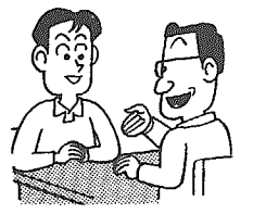
青少年を非行からまもる 全国強調月間 (7月1～31日)

七月は、社会を明るくする運動の月間です。 この運動は、すべての国民がそれぞれの立場において犯罪や非行の防止と罪を犯した人たちの立ち直りに 七月は、社会を明るくする運動の月間です。この運動は、すべての国民がそれぞれの立場において犯罪や非行の防止と罪を犯した人たちの立ち直りに 温い愛の手をさしのべ、犯罪や非行のない明るい社会を築こうとする運動です。 運動の重点目標は、「少年の非行防止と更生の援助のため地域住民の理解と参加を求める」ということです。 私たちの地域社会から非行に走る少年を出さないよう、ひとり一人が力を合わせましょう。 また、不幸にして非行に陥った少年の更生を援助するため皆様のご協力をお願い致します。