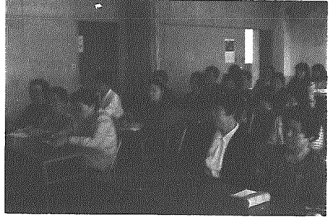
熱心に耳を傾ける聴講生

と、思っているのもっと学習を重ねるべきだ。その地域に住んでいてどれだけ誇りがもてるか、学習していった下さい。というようなことを話された。また、市長は、日本で一番すばらしい文化は、阿賀野川の景観だと考えている。特に、満願寺周辺から見た景観は、各国をまわってきたが世界中にない。人と物の交流だけでなく、自然景観が培われてきた阿賀を理解して、地域文化を見直し、河川博物館をつくることも提唱している。