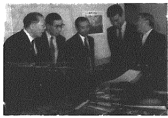
いい作品が集まりましたねと語る審査員の皆さん

村では、見どころいっぱい横越村というテーマを掲げ、風景に限らず祭、イベントなど横越村を再発見してもらおうと写真を募集してきました。第一回から第二回までの景観再発見事業では、写真のほか絵画、短歌、俳句、川柳などの文芸部門も実施してきましたが、今回からは、写真のみを募集しました。四十七名