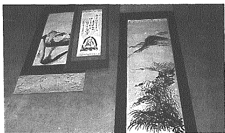
今、取り組んでいる数々の表具

自分が今までつくったものを親類や友人にあげて、たいへん喜ばれている。ところで、物にもよるが、