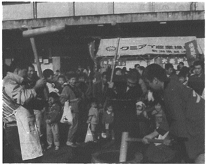
二日間も好天に恵まれ、にぎわった農業祭