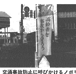
交通事故防止に呼びかけるノボリ