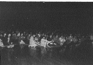
500人の観客が詰めかけた中学校体育館