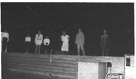
命の尊さを訴える「グッドバイマイ…」