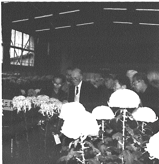
愛好者の見守る中、菊花展を審査

十一月三日、四日の二日間 中央公民館主催による文化祭が開催され、大勢の人で賑わいました。