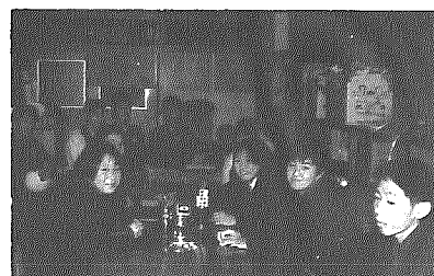
文化祭の議論をする生徒会

もぜひ上演会にご来場して下さいと言っていました。 ○日時 十二月十日(木) 午後七時 ○会場 中学校体育館 生徒会役員の声