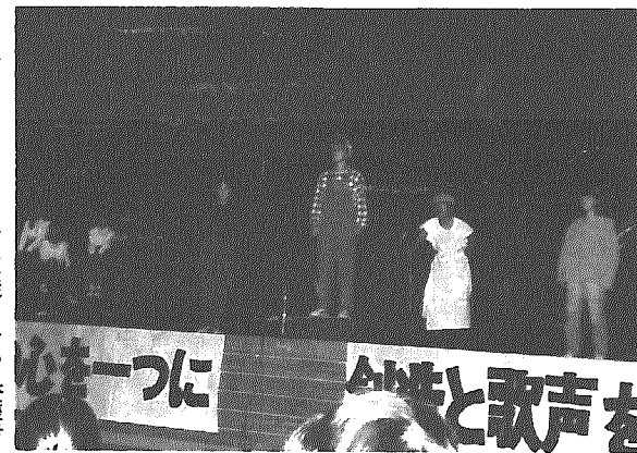
観客に感動を与え、再演が決まった演劇

文化祭のアンケート調査をしたら、少数意見であったが演劇という声があり、生徒会で議論した結果、今までとは変わった文化祭にしたいということと企画をしたそうです。