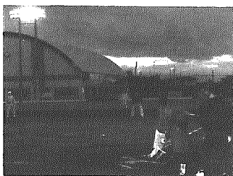
ナイター設備を使つての試合

冬場は日が短くどうしても練習時間が少なくなります。グラウンドの状態のよい時に生徒も使えると張り切っています。