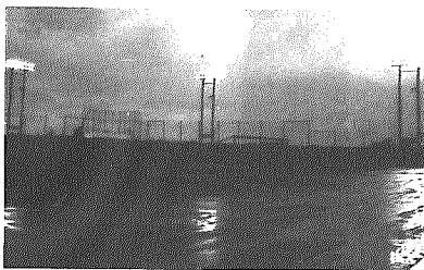
ナイター設備に点灯