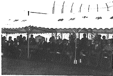
11月1日行われた点灯式