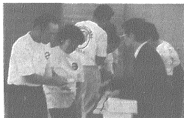
指導員に指導者認定証交付