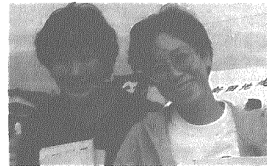
気持ちよかったね