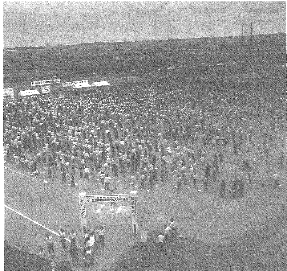
3,600人のラジオ体操会 (撮影 本間一人さん)

明治34年11月、横越村、沢海村、木津村、二本木村、小杉村の5村が合併して、今年で91年になります。 ①合村90周年記念事業の一つとして②横越中学校体育施設(グラウンド・野球場・体育館)の完成を祝って③これを契機にラジオ体操の村を宣言し、村民の体育・スポーツ活動を通じて住民のコミュニケーションと健康づくりの推進のため、NHK「特別巡回ラジオ体操会」を招致しました。