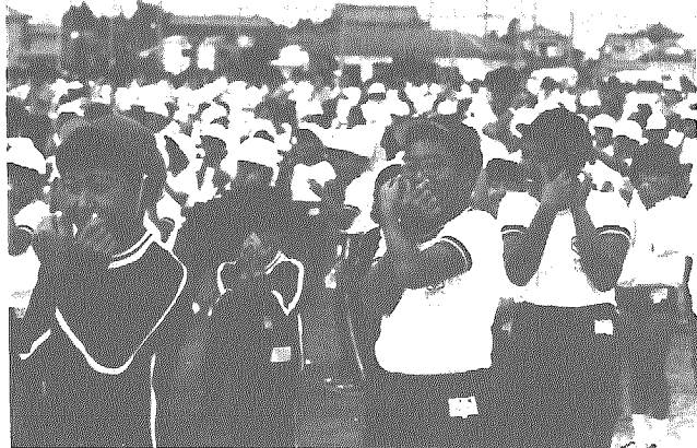
本番〇〇分前 リラックス