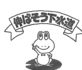
下水道で住みよい環境づくり

「下水道、きれいな水を未来まで」 9月10日は全国下水道促進デーです。 今年で、「全国下水道促進デー」は、第三十二回を迎え、毎年九月十日に建設省、厚生省が主催して行う全国的な行事です。 今日、私たちの生活産業活動によって生じる汚水は、河川、湖沼、海等公共用水域の汚染の形で見れば自然破壊の元凶となっております。特に私たちの住んでいる亀田郷においては、近年の著しい都市化によって鳥屋野濁の水質汚濁が進み大きな社会問題となっております。現在その水質浄化のため、新潟県及び流域三市町村(新潟市・亀田町・横越村)では、莫大な費用をかけた諸施設を実施中ですが、まだ環境基準には達していません。根本的な対応策としての下水道の果す役割が非常に大きなものとなっております。 ◇下水道の役割 ◇汚れた水が河川、湖沼、海等へ直接流れ込むことがなくなり、公共用水域の水質がきれいになります。 ◇汲み取り便所が水洗便所になり衛生的で快適な生活ができるようになります。 ◇排水路への汚水流入がなくなるため、悪臭やハエ、蚊の発生がなくなります。 ◇水洗化について 下水道工事が終わりますと公共下水道を使用できる日と