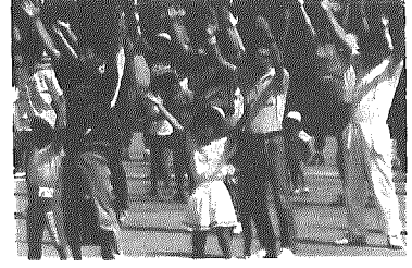
木津地区ラジオ体操練習会